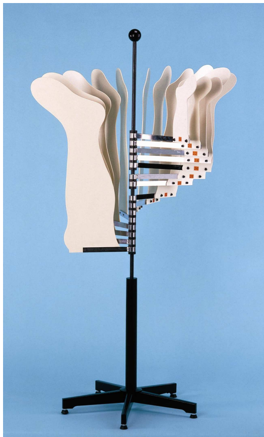
Formes chaussettes sur support fixe *